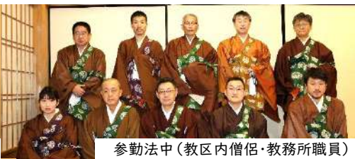
参勤法中(教区内僧侶・教務所職員)