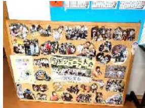
同朋ジュニア大会報告▼