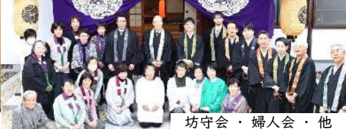
坊守会・婦人会・他