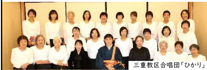
三重教区合唱団「ひかり」

「報恩講」へのご参詣、ご参勤、ご奉仕を賜り、おひとりおひとりのお力により本年度も別院報恩講を無事厳修できましたこと、厚く御礼申し上げます。次年度の「報恩講」に向けて、お念仏と共に、「知恩報徳」の一年を歩まれますよう念じ申し上げます。