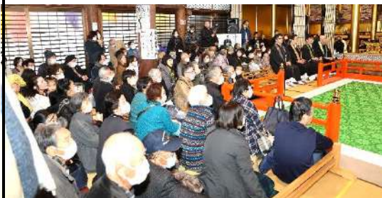
▲多くの方が参詣され、満堂の中で舞樂が行われた ▼舞人と15名の楽僧による法要舞樂の様子