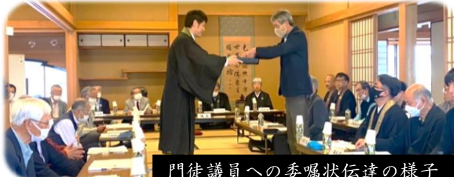
門徒議員への委嘱状伝達の様子