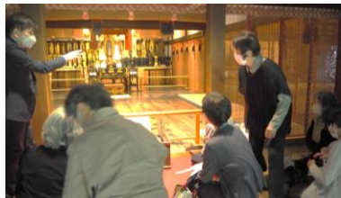
青蓮院門跡 宸殿(お徳度の間)

婦人会と共にお配りした甘茶や「花まつり」のリーフレットは用意した400余りすべてなくなりました。