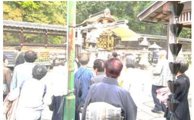
大谷祖廟 御廟(御墓所)

天台宗の青蓮院門跡へ、また親鸞聖人の御墓所である大谷祖廟に参拝し、職員より丁寧にご案内をいただきました。帰りのバスでは法務員が楽しいゲームを次々に披露し、盛り上がりの中で桑名別院に到着しました。