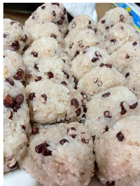
↑最近持ち帰ったおこわおにぎり

次に帰省する時も、キャリーバックの半面に荷物とお土産の赤福を詰めて、いつものように半面は空にして帰ろうと思います。