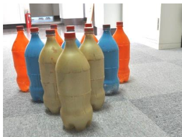
ペットボトルボーリング